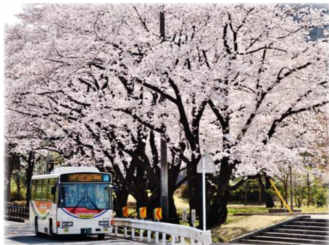
2018 年度 国際十王交通賞「さくら」